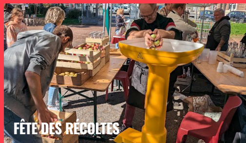
FÊTE DES RÉCOLTES