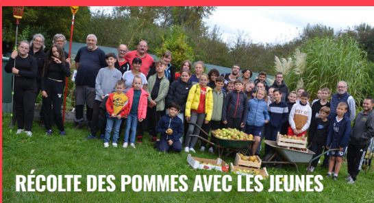
RÉCOLTE DES POMMES AVEC LES JEUNES