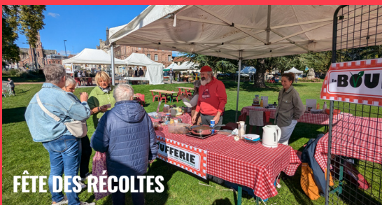
FÊTE DES RÉCOLTES