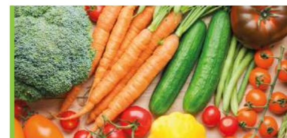
MOIS DE L'ALIMENTATION P 7