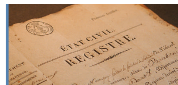
EXPRESSION LIBRE - ÉTAT-CIVIL P18-19