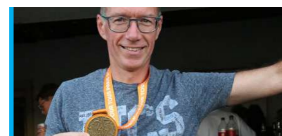
SPORTS P 9