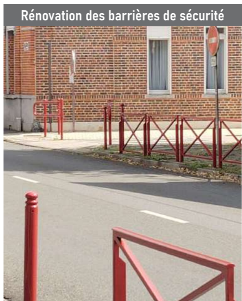
Rénovation des barrières de sécurité

Comme évoqué en page 10, l'ancienne gare est en cours de rénovation. Avant de lancer les travaux, il a fallu vider le bâtiment, qui abritait jusqu'à présent l'association Mercure, qui a souhaité cesser son activité.