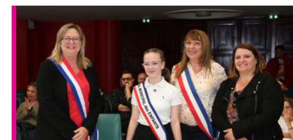
CONSEIL MUNICIPAL DES ENFANTS P 8