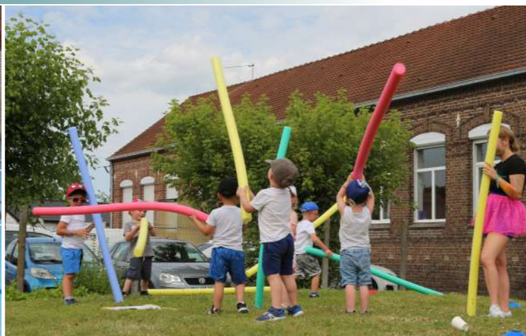
CENTRE DE LOISIRS ESTIVAL Juillet 2024