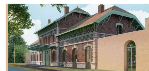
REQUALIFICATION DE LA GARE P10-13