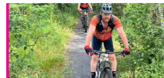
AGENDA DES FESTIVITÉS P16-17