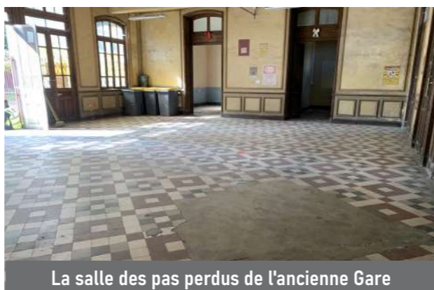
La salle des pas perdus de l'ancienne Gare

Grâce à ces interventions estivales, notre commune continue de briller et d'offrir un cadre de vie agréable à tous ses habitants.