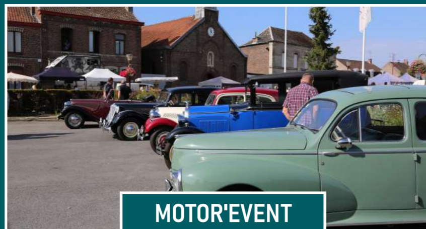
MOTOR'EVENT 25 août 2024