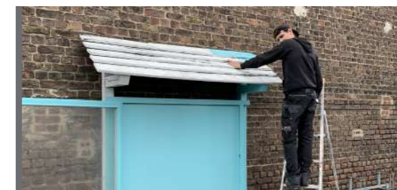
TRAVAUX P 6