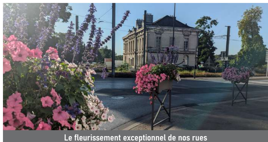
Le fleurissement exceptionnel de nos rues