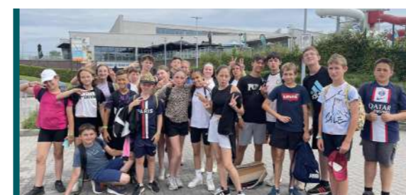
ALBUM PHOTOS - BRÈVES P 14-15