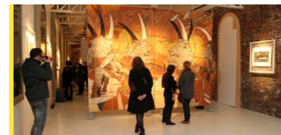
LE QUARTIER A 10 ANS P 4-5

Au moment où ce Reflets est distribué, la Cérémonie intercommunale de commémoration du 80 e anniversaire de la Libération du Pays de Condé, en collaboration avec Condé-sur-l'Escaut et Vieux-Condé, aura été, sans nul doute, un moment plein d'émotions et de souvenirs pour que jamais nous n'oublions.