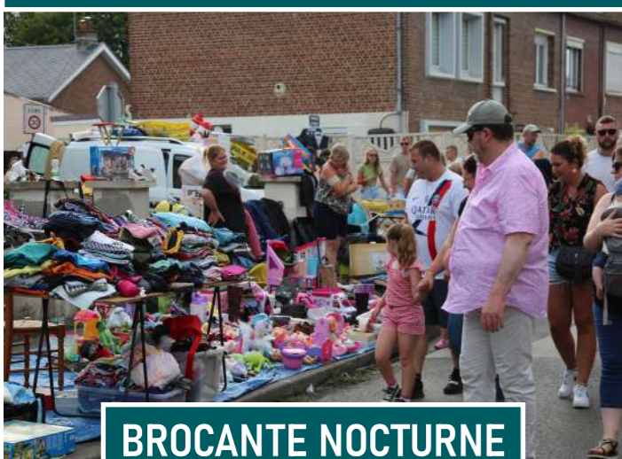
BROCANTE NOCTURNE 14 août 2024